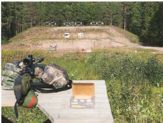
Synfältstestet syns på 50-metersvallen. Med riktpunkt mot den röda plastdunken noterades vad som gick att se i bildens högerkant. Där motsvarade vit plasthink ett synfält om 30 m på 100 m avstånd, liten grön metalldunk 35 m samt vit vattenkockare 40 m.